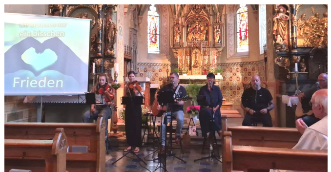
Fotos Segensfeier für Ehepaare und Verliebte