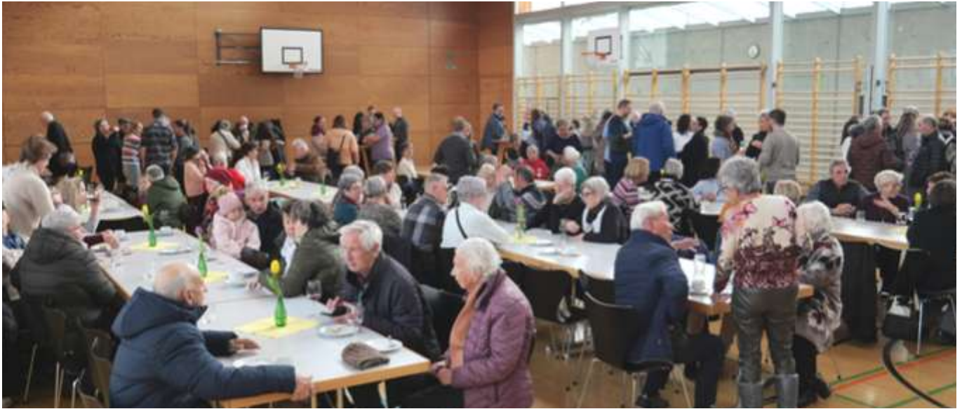
Agape im Frödischsaal: Begegnung und echtes Miteinander.