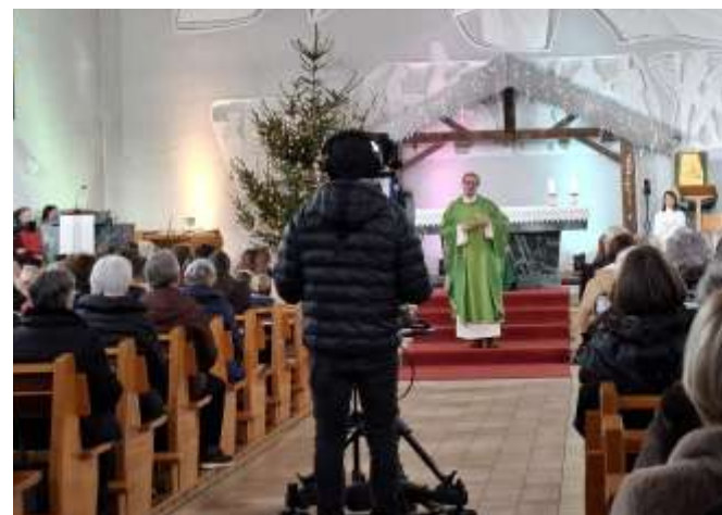
Live-Moment – Muntlix sendet in die Welt.

Nicht im Außergewöhnlichen allein, sondern im aufmerksamen Blick, in der kleinen Geste, im mutigen Handeln zeigt sich, was von Weihnachten bleibt.