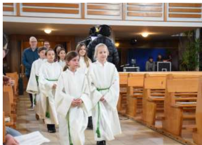
Generalprobe – jetzt wird es ernst.