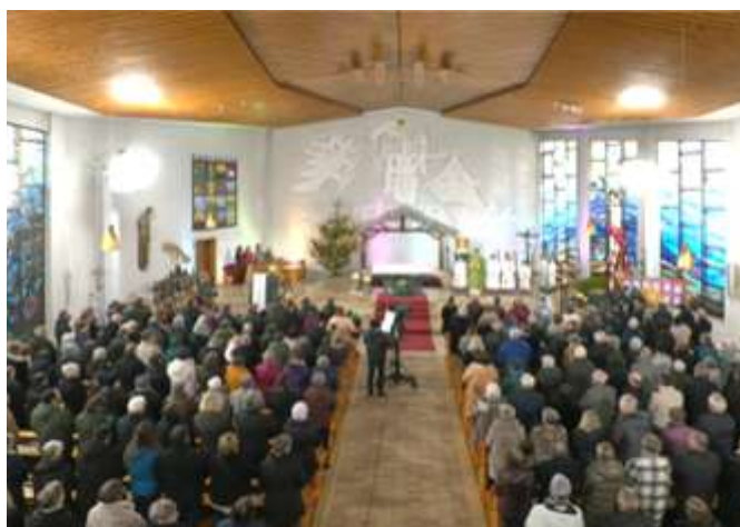
Volle Kirche, spürbare Energie.

Die Kirche wird weiter als ihre Mauern. Menschen vor Bildschirmen – in Wohnzimmern, Pflegeheimen oder Krankenzimmern – feiern mit.