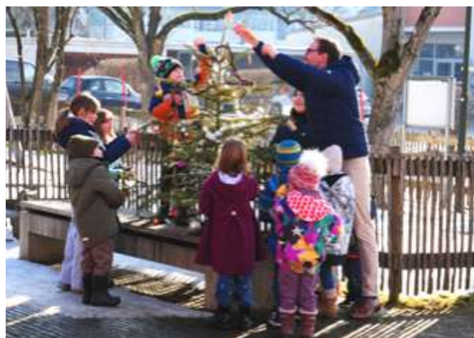
Was bleibt nach dem Abräumen?