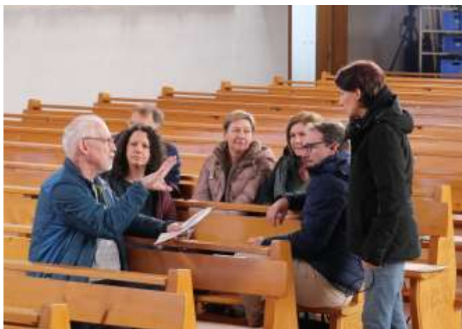
Viele Rollen, ein gemeinsames Projekt.