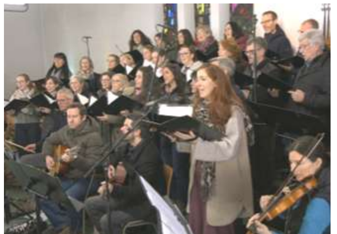
Sound, der unter die Haut geht.

Die musikalische Gestaltung verleiht der Feier Tiefe und Weite. Das Wyllar Chörle und die Musikerinnen und Musiker tragen die Botschaft mit ruhiger Kraft. Unterstützt werden sie vom Kinderchor der Volksschule Muntlix.