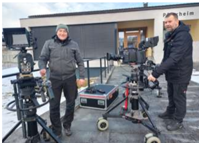
Teamwork hinter den Kulissen – alles läuft zusammen.

Technische Aufbauarbeiten und Abstimmungen Stellproben und Generalprobe Live-Übertragung der Sonntagsmesse Agape im Frödischsaal Nachklang durch zahlreiche Rückmeldungen.