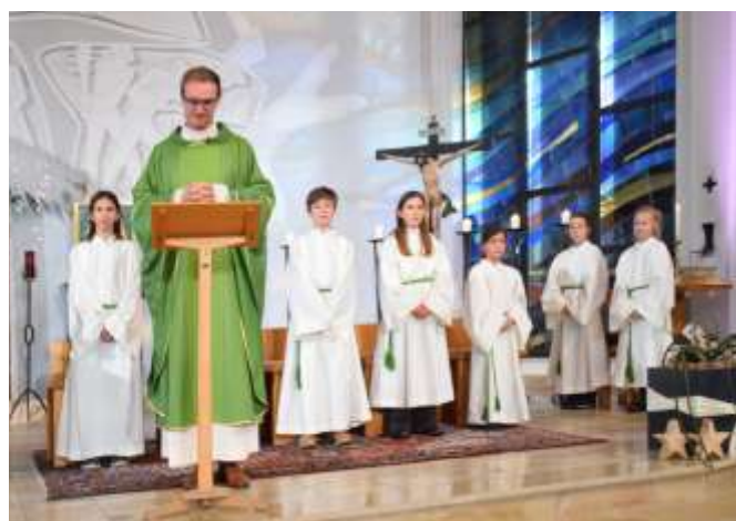
Feinschliff im Ablauf – jeder Schritt sitzt.