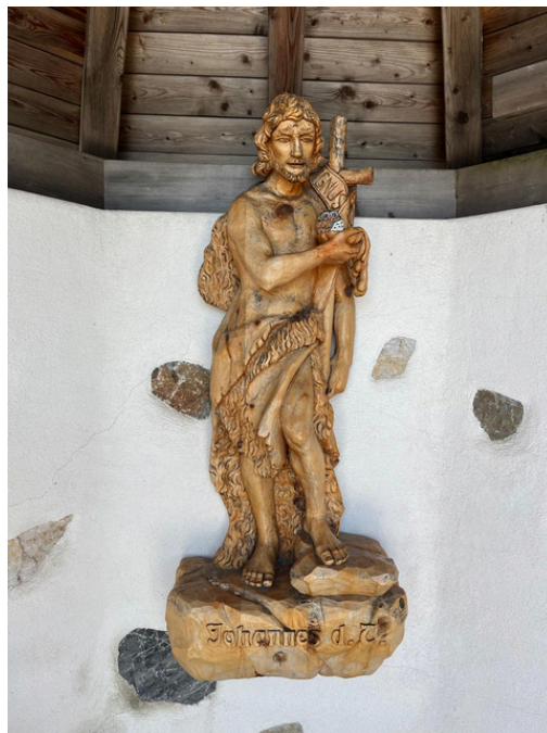
(Hl. Johannes am Schöckl)